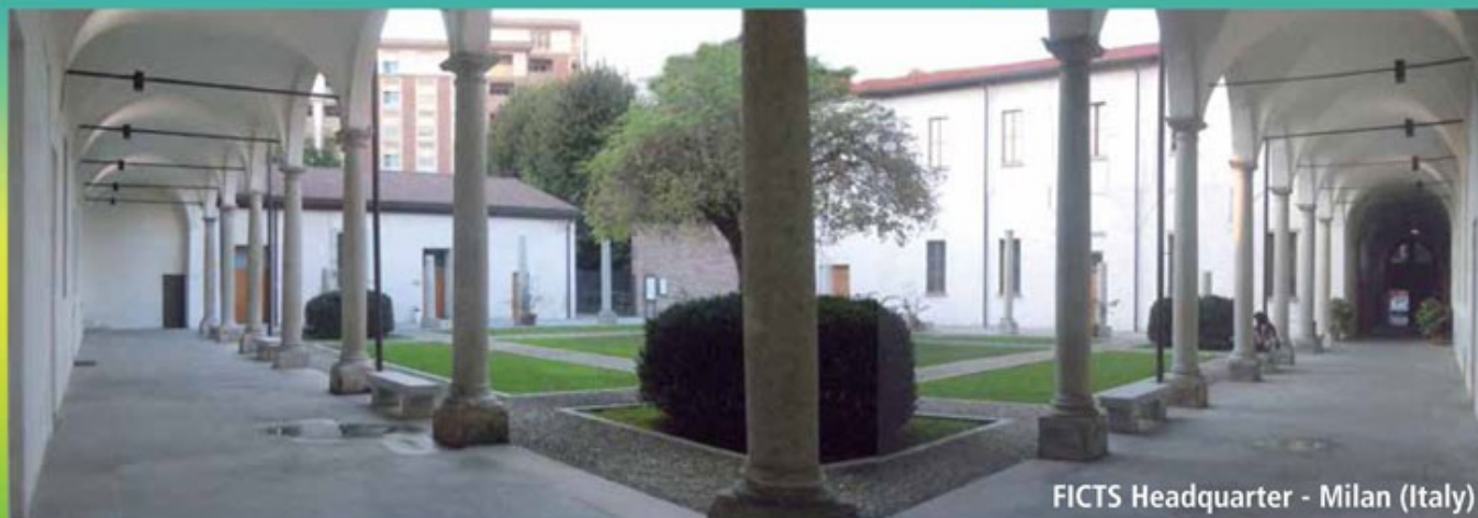
FICTS Headquarter - Milan (Italy)