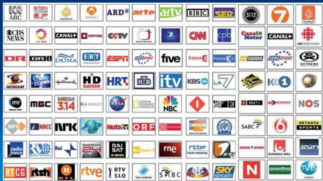
TV SPORT EMOTIONS AWARD 2012