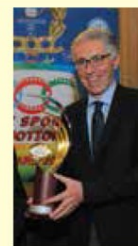
TV SPORT EMOTIONS AWARD 2015