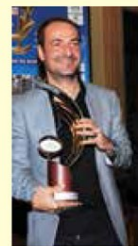
TV SPORT EMOTIONS AWARD 2013