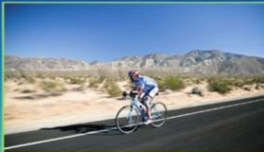
RESPECT OF THE RULES